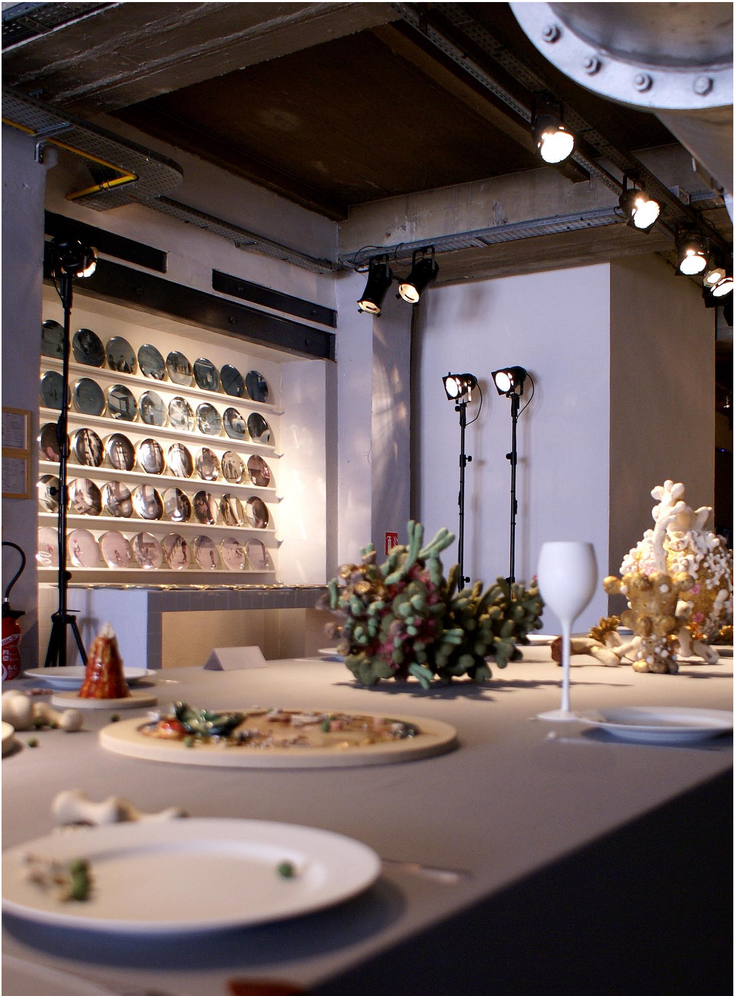
Vue de l'exposition 2008 «Petits bouleversements au centre de la table» Fondation de la Manufacture Bernardaud / Limoges / France