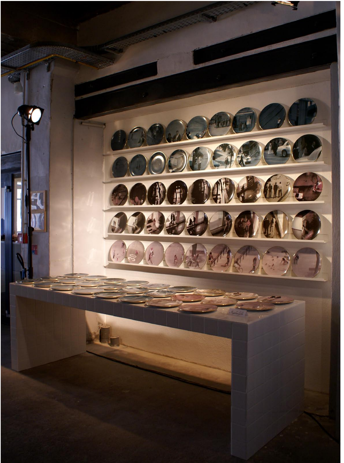
Vue de l'installation des 73 assiettes uniques.