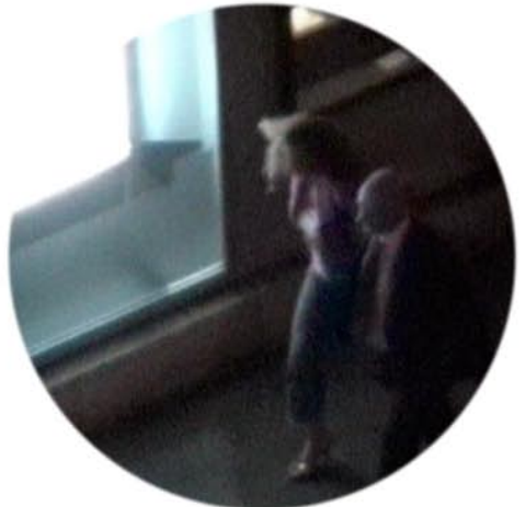
Une sélection d'extraits vidéos imprimés et présentées lors de l'exposition «petits bouleversements au centre de la table» à la Fondation Bernardaud à Limoges/F en 2008.